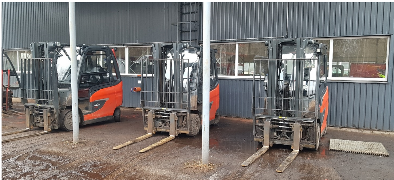
Tre af de seks nye elektriske gaffeltrucks klar til opladning.

En ekstra funktion øger sikkerheden, idet de nye gaffeltrucks er installeret med et overvågnings- og advarselssystem: fodgængere i arbejdsområdet er iført særlige sikkerhedsveste, og når gaffeltrucken registrerer fodgængere eller andre gaffeltrucks i nærheden, giver den et advarselssignal for at undgå kollision. Denne automatiske kommunikation mellem medarbejdere og udstyr reducerer farlige situationer og er et fantastisk værktøj i vores bestræbelser på løbende at reducere antallet af arbejdsrelaterede skader.